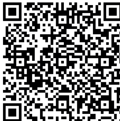
Código QR - Video.