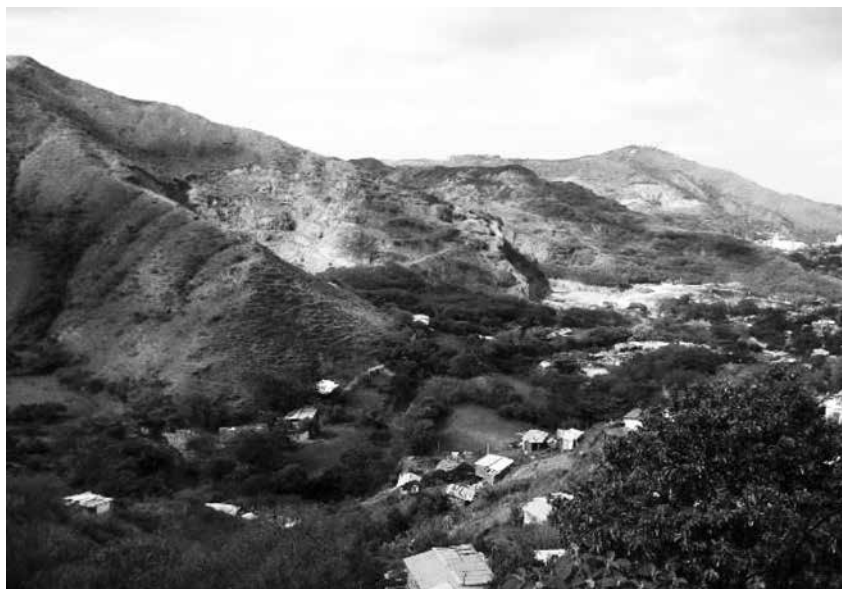
Ilustración 24: Contexto de ejecución del proyecto: AHDI Las Palmas 1