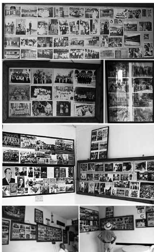
Ilustración 23: Álbumes fotográficos comunales hallados en territorio.