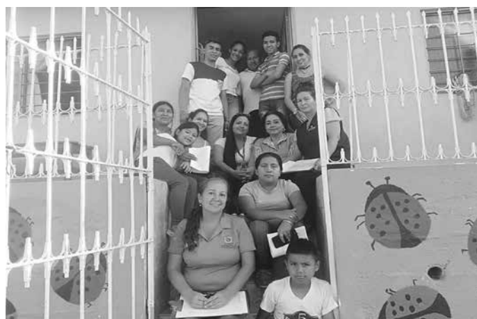
Ilustración 25: Participantes de la comunidad en el proyecto

Acciones de emprendimiento socioambiental. Se plantearon actividades para el fortalecimiento psico-social que permitió sensibilizar sobre la importancia de crear, mantener y disponer de espacios (físicos y temporal) donde el colectivo de mujeres lideresas se reúnan periódicamente y logren proyectar un desarrollo colectivo integral organizado.