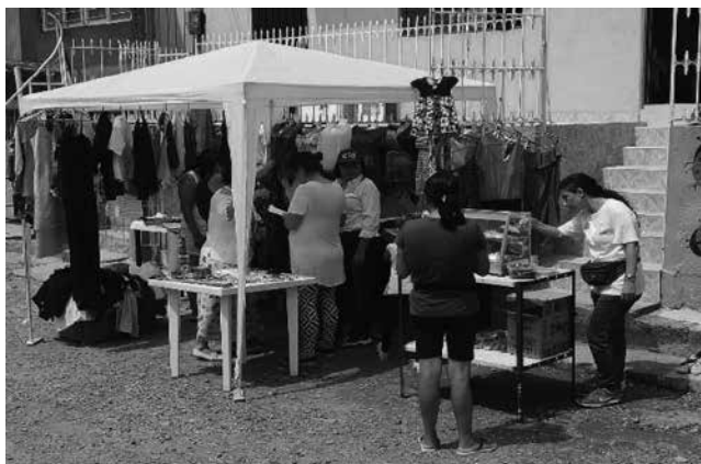
Ilustración 27: Pulguero Innovando Ando