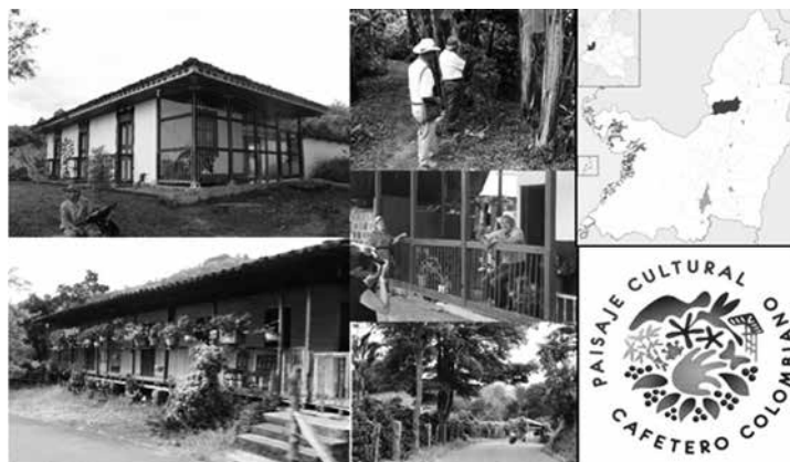
Ilustración 22: Contextualización del territorio de ejecución del proyecto