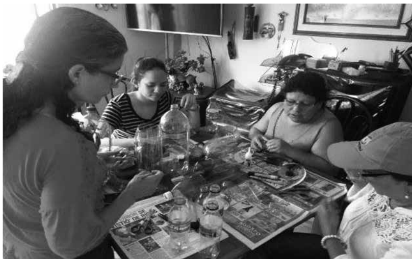
Ilustración 29: Taller de reúso