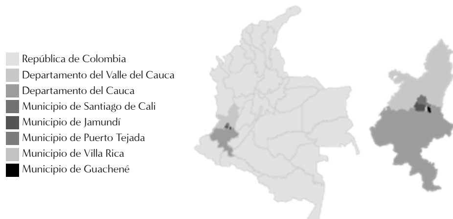
Ilustración 21: Zona de ejecución del proyecto

Los municipios se seleccionaron aplicando criterios como: haber implementado la política de participación en el Sistema Nacional de las Juventudes; tener organizaciones juveniles y mecanismos para la participación local, entre ellos, los Consejos Municipales de Juventud y las Plataformas de las Juventudes.